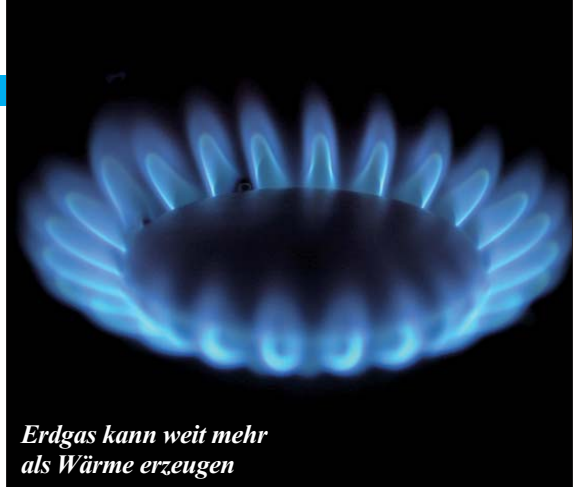
Erdgas kann weit mehr als Wärme erzeugen

Eine sichere Versorgung mit Energie hat gerade in den Wintermonaten höchste Priorität. Seit den 70er-Jahren hat sich die Erdgasnachfrage mehr als verdreifacht.